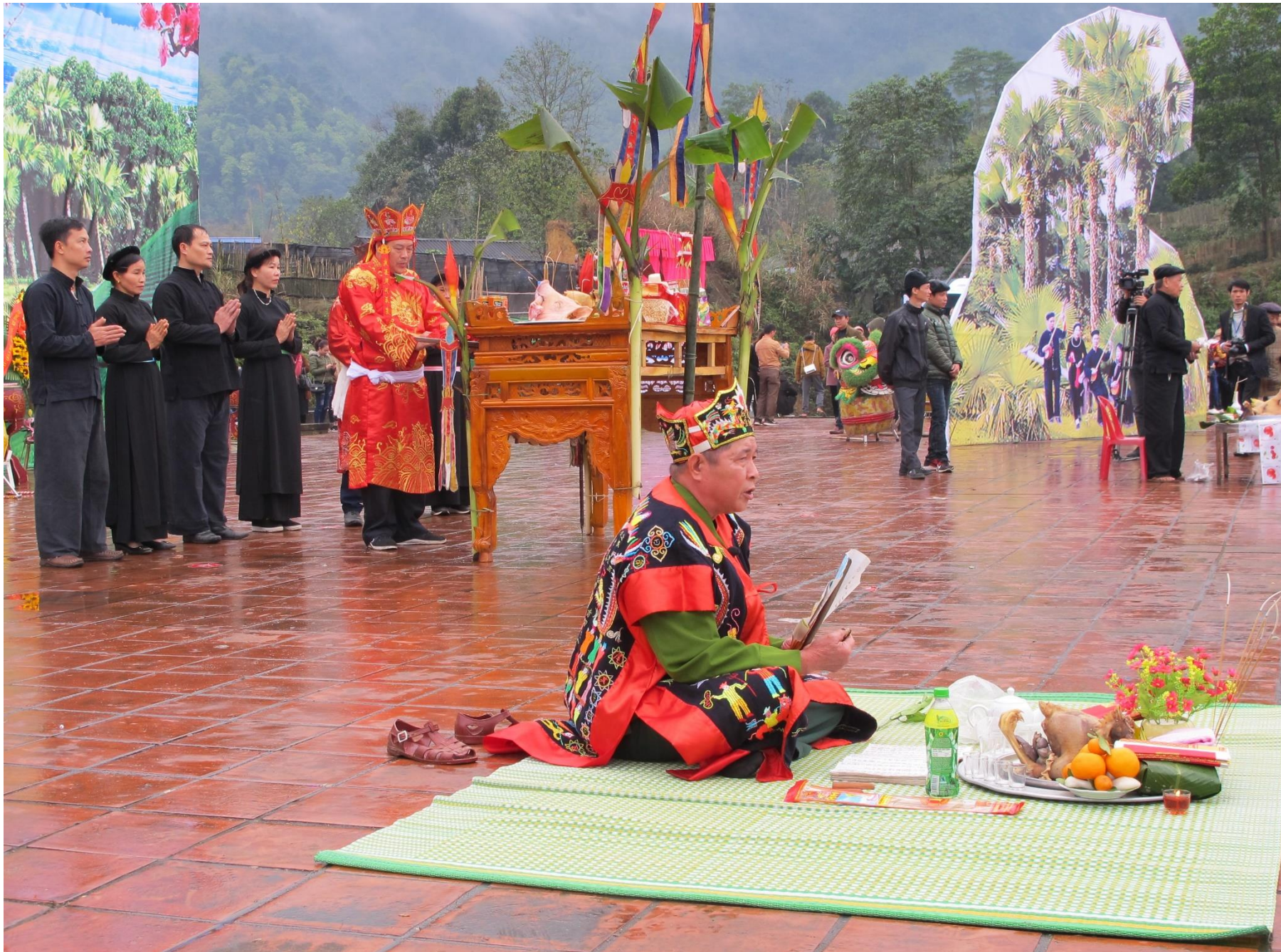
Nghi lễ cầu mùa tại lễ hội lồng tồng (Thái Nguyên)