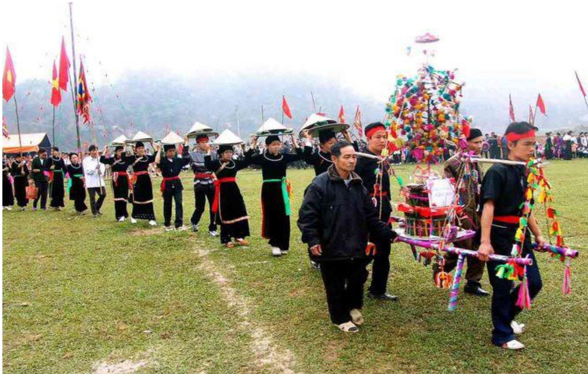
Lễ hội lồng tồng ở Ba Bể (Bắc Kạn)